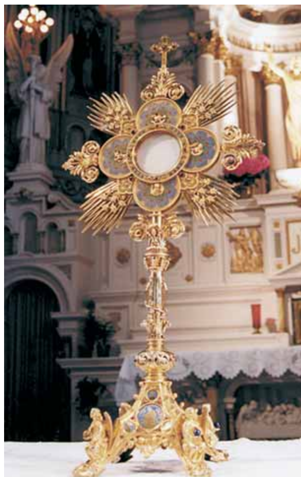
Ostensorio qui est conservé dans le sanctuaire de sainte Julienne à Liège